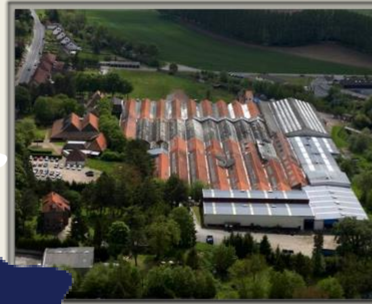
Auxi Le Château 62 – Haut de France